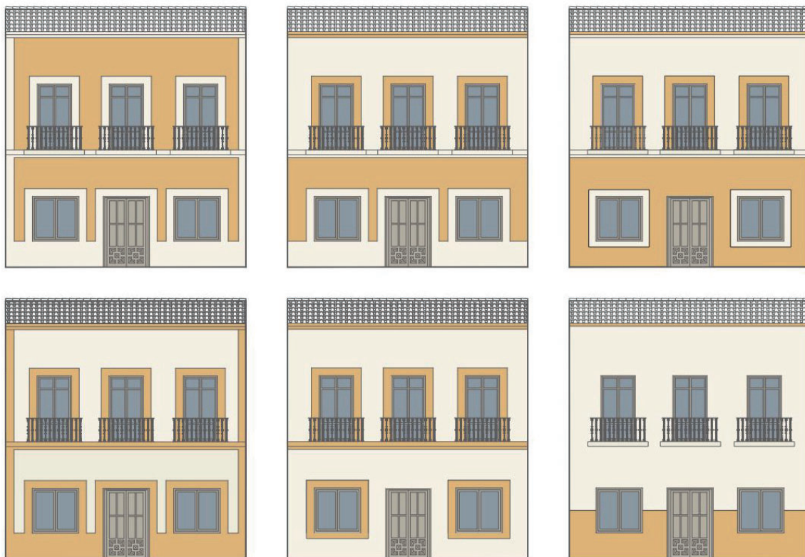
TIPOLOGIA PINTURA FACHADAS PLAZA DE ESPAÑA- VILLATOBAS